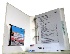
Geballtes Wissen für jede Region im Teilnehmerordner

Es gewann die Trennschärfe der Seminauraussagen, was leicht zu illustrieren ist: Persönliche Beziehungen sind zwar in all diesen Businesskulturen - ausgenommen Israel - wichtiger als in Deutschland. Dies in jeder Region stereotyp zu wiederholen, wäre aber ermüdend und viel zu grob. Interessant sind ja auch die Unterschiede zwischen Japan, Korea, China, Taiwan etc. Daher zeigten die BCCM-Trainings detailliert auf, welche Bestandteile das Kommunizieren zum Aufbau persönlicher Beziehungen in dem jeweiligen Land hat.